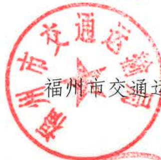
福州市交通运输局