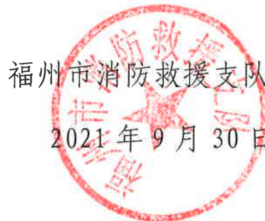
福州市消防救援支队