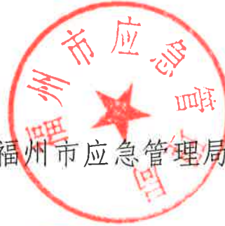
福州市应急管理局