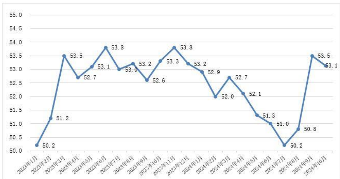
图1 2023年1月-2024年10月分月福州市物流业景气指数（LPI）走势图

10月，福州市物流业景气指数（LPI）为53.1%（见图1），虽较上月小幅回落0.4个百分点，但物流市场整体运行仍保持平稳。12个单项指数“十降一升一持平”，其中从业人员指数小幅回升0.4个百分点，固定资产投资完成额指数与上月持平。其他各项指数回落幅度在0.3至2.9个百分点之间，其中主营业务利润指数回落2.9个百分点（见表）。