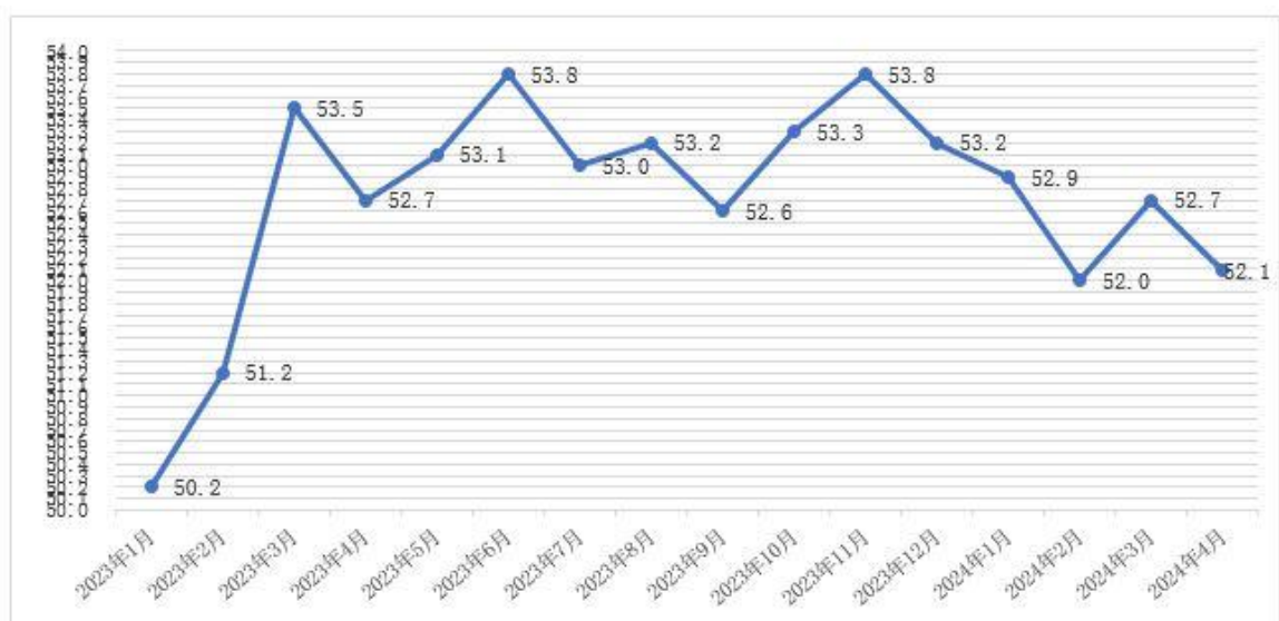
图1 2023年1月-2024年4月分月福州市物流业景气指数（LPI）

4月份，福州市物流业景气指数（LPI）为52.1%（见图1），虽较上月回落0.6个百分点，但仍保持在扩张景气区间。12个单项指数“九降三升”：其中，固定资产投资完成额指数、库存周转次数指数与从业人员指数较上月回升，分别回升0.7个、0.8个与0.4个百分点。其余9项指数较上月均有不同程度回落，指数回落幅度在0.8至4.6个百分点之间，主营业务成本（逆指标）指数回落4.6个百分点（见表）。