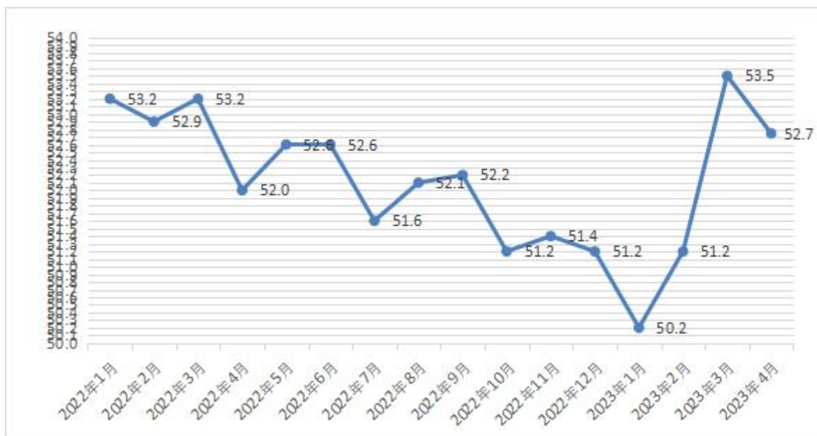
图1 2022年1月-2023年4月分月福州市物流业景气指数（LPI）走势图

在经历一季度加快恢复，以及外部需求放缓，4月份物流活动有所放缓，物流业景气指数（LPI）较上月回落0.8个百分点，为52.7%（见图1）。12个单项指数“七降四升一持平”：其中，从业人员指数较上月持平。固定资产投资完成额指数、业务活动预期指数、物流服务价格指数与主营业务利润指数较上月回升，分别回升0.9个、0.7个、0.5个与2.8个百分点。其余7项指数较上月均有不同程度回落，回落幅度在0.7至1.0个百分点之间（见表）。